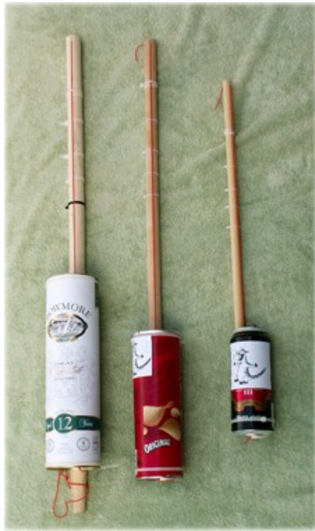
Kuvassa vasemmalta oikealle viskibasso, sipsibasso ja kaljabasso.